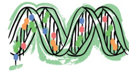
DNA GLOW LAB

Das Kit enthält DNA-Proben, Puffer, Fluoreszenzfarbstoff, Reaktionsgefäße. Das Kit erlaubt eine Vielzahl von Experimenten die zeigen, wie eine Doppelhelix gebildet und wieder aufgelöst werden kann. Ausführliche Lehrmaterialien unter https://www.minipcr.com/product/dna-glow-lab-structure/ , deutsche Lehrmaterialien können zur Verfügung gestellt werden. Auf Anfrage bieten wir Fortbildungen an.